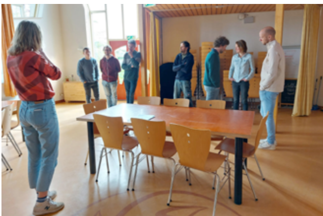
Foto van een focusgroep tijdens het onderzoek.

De vragenlijst werd ingevuld door 80 BD-boeren. Tijdens twee focusgroepen van elk zes en zeven boeren werd dieper op de uitkomsten van de vragenlijst ingegaan, en er zijn vijf diepte-interviews gedaan.