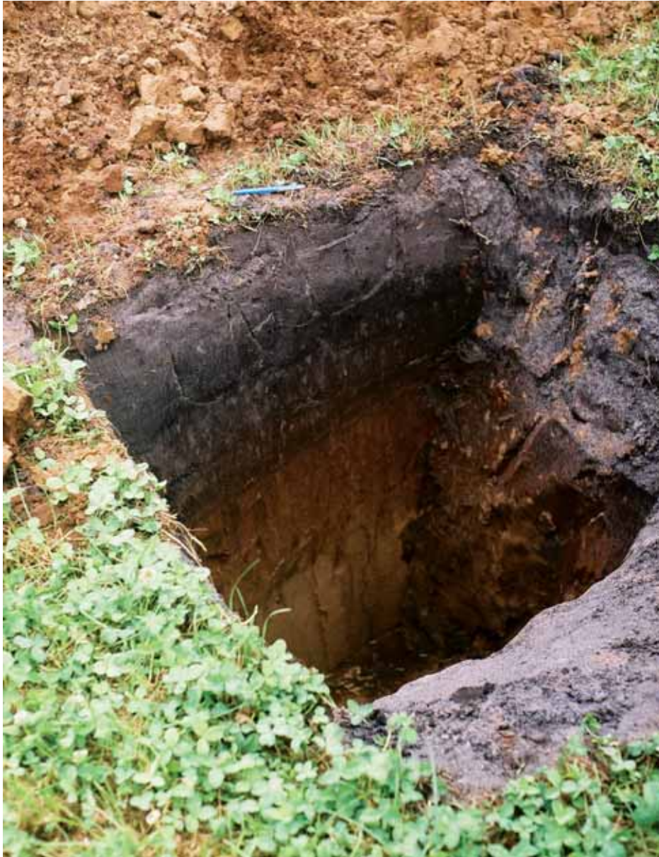
Foto 3. De gronden in het gebied het Hengstven zijn overwegend veldpodzolen.

A.J.F.M. Opstal & F.J. van Zadelhof, 2001. Handboek Natuurdoeltypen: tweede herziene editie. Expertisecentrum LNV, Wageningen. Chardon, W.J. & F. Sival, 2003. Fosfaat: knelpunt voor realisering EHS op voormalige landbouwgronden? De Levende Natuur 104(6): 267-271. Chardon, W.J., F. Sival & G. Koopmans, 2005. Reactie op Fosfaat als adder onder het gras: afgraven of uitmijnen? H 2 O. Duuren, L. van, G.J. Eggink, J. Kalkhoven, J. Notenboom, A.J. van Strien & R. Wortelboer, 2003. Natuurcompendium 2003 -Natuur in cijfers. Uitgaven Centraal Bureau voor Statistiek en Milieu- en Natuurplanbureau, Voorburg/Bilthoven/Wageningen. Eekeren, N. van, E. Heeres, G. Iepema & H. van der Meer, 2005. Kalibemesting van gras-klaver op biologische melkveebedrijven. Bioveem-rapport nr 9, Lelystad. Eekeren, N. van, G. Iepema & F. Smeding, 2006a. Evenwichtige verschralling van natuurgronden. Eindrapportage 2002-2005, Driebergen. Eekeren, N. van, J. Bokhorst & D. van Liere, 2006b. Gras- en klaverzode instrument voor verbeteren bodemkwaliteit. In: V-focus april 2006.