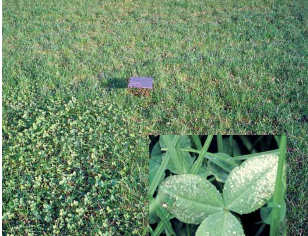
Foto 1. Klaver reageert sterk op kalibemesting. Overal waar geen kali is bemest valt de klaver weg.

In de proef produceerde de variant met kalibemesting na 3 jaar bijna het dubbele van de variant zonder kalibemesting (fig. 1). Door de kalibemesting blijft de klaverproductie inderdaad op peil en wordt vervolgens de totale productie aangejaagd door de stikstofbinding van de klaver (foto 1). Het verschil in fosfaatafvoer tussen de beide bemestingsvarianten is echter in verhouding kleiner: gemiddeld 95 respectievelijk 79 kg P 2 O 5 ha -1 per jaar met en zonder kalibemesting (fig. 2). De oorzaak is dat er