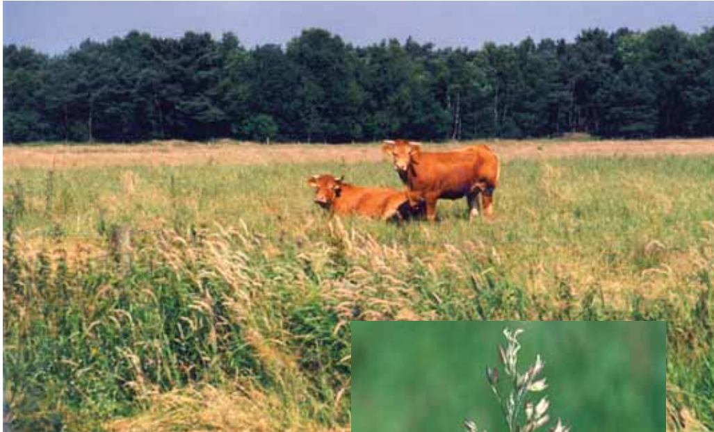
Foto 2. 'Traditioneel' verschrallingsbeheer op het Hengstven. Foto 2a. Gestreepte witbol ( Holcus lanatus ) is kenmerkend voor percelen met traditioneel verschrallingsbeheer van maaien en afvoeren.

Het driejarige experiment in het Hengstven toont aan dat gras met Witte klaver de fosfaatafvoer op een hoog peil kan houden. Berekeningen voor het proefperceel geven aan dat de streefwaarde voor fosfaatbeschikbaarheid in de laag 0 - 30 cm binnen 10 jaar gehaald kunnen worden en voor P-totaal binnen 20 jaar. In vergelijking hiermee zal op gronden met een sterkere fosfaatbinding, de streefwaarde voor fosfaatbeschikbaarheid sneller gehaald worden, maar de streefwaarde voor P-totaal relatief langer duren. Gezien de meestal meerjarige overgangperiode tussen de verwerving van landbouwgronden en start van herinrichting liggen hier mogelijkheden voor effectieve toepassing van het concept van 'gras-klaver met kalibemesting'. Anders dan met afgraven, kan er meteen na aankoop van een gebied mee begonnen worden. Tijd is hierbij belangrijk, omdat des te langer er gewacht wordt met uitmijnen, des te meer fosfaat er lekt naar diepere grond-