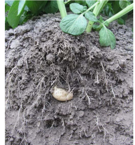
Afbeelding 1: Bodemprofiel bij compost veldtest

De uitkomsten zijn van slechts 1 jaar experimenteren. Ook was het een nogal uitzonderlijk jaar vanwege de droogte. Er zal in 2019 een vervolg aan de veldtesten worden gegeven.